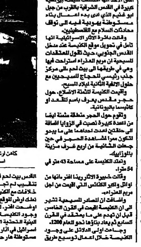
كاميرا ترونكسي يسيروا في الصخرة الكبيرة التي يعتقد ان مريم العذراء استراحت عليها في طريقها الى بيت لحم لتضع المسيح بالموذون.